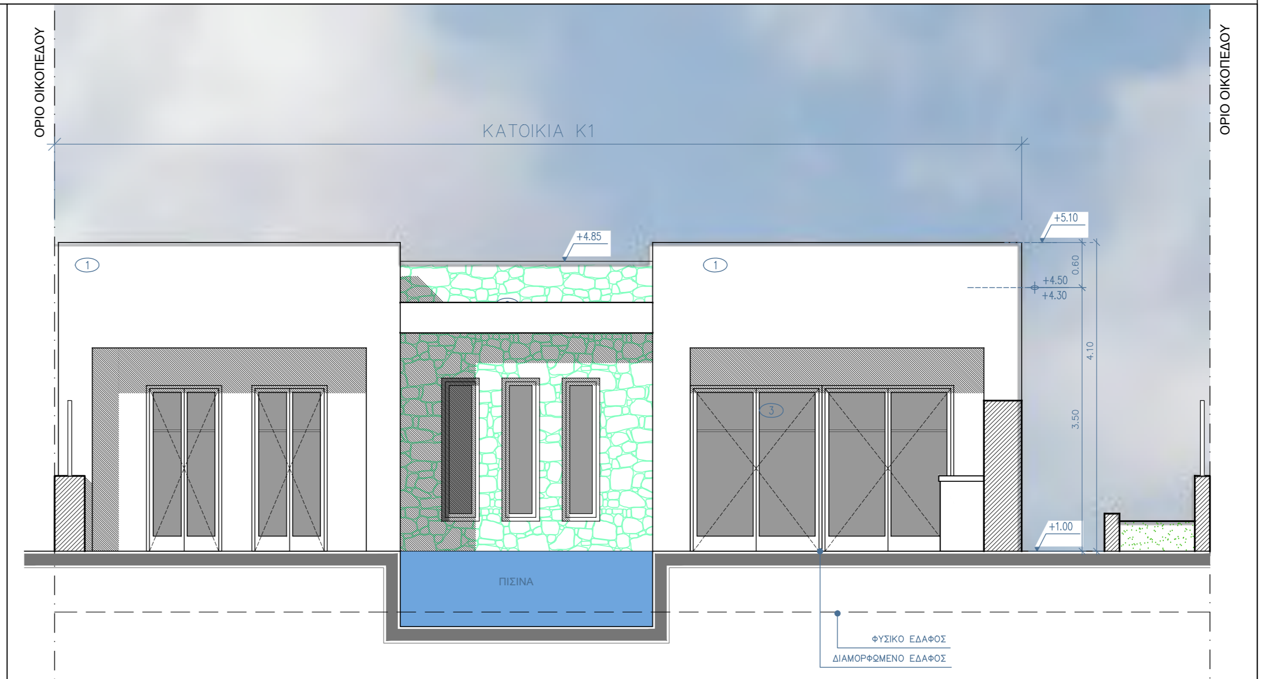
ΑΝΑΤΟΛΙΚΗ ΟΨΗ ΚΑΤΟΙΚΙΑΣ Κ1 1:50 2